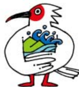
トキ野生復帰シンボルマーク

お問い合わせ先 新潟県県民生活・環境部環境企画課 電話 025-280-5150